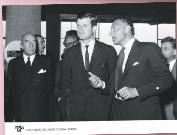
Torino, costruzione della sede Rai di via Verdi, 10 luglio 1964 L'avvocato Gianni Agnelli e Ted Kennedy visitano Italia '61